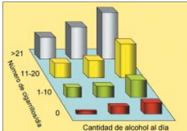
Gráfico. 3. Riesgo de cáncer bucal en relación al alcohol y tabaco en hombres.

La relación del tabaco con el cáncer es clara en los tumores localizados en la zona retromolar y en el suelo de la boca, a diferencia del de lengua y mejillas, donde no se ha demostrado una relación significativa (fig. 2). En un estudio en varones, el tabaco se asociaba más con las lesiones en paladar blando que con otras en la zona anterior, siendo la localización de cánceres en el suelo de la boca y en la lengua mucho mas frecuente entre los consumidores de alcohol 15 .