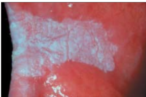
Figura 3. Leucoplasia de las comisuras en un gran fumador.

Entre los fumadores empedernidos, y especialmente entre los que fuman en pipa, se presentan con frecuencia lesiones blancas en el paladar duro, a menudo combinadas con lesiones rojas, localizadas en la zona central en forma de pequeños nódulos elevados (fig. 5). En Escandinavia, la frecuencia es del 1-2% 17 . Este cuadro, llamado "paladar del fumador", es asintomático y desaparece poco después de abandonarse el hábito de fumar (fig. 6). No es premaligno. La queratosis palatina que aparece al dejar de fumar, observada en algunas zonas del mundo, sí es una lesión premaligna.