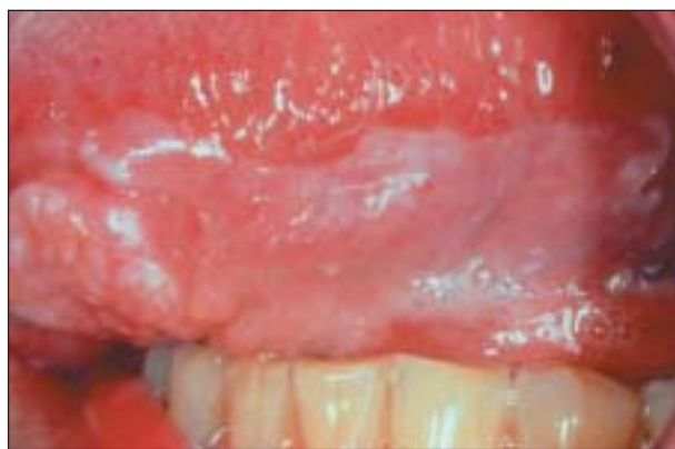
Figura 4. Transformación maligna de una leucoplasia de la lengua en un fumador.