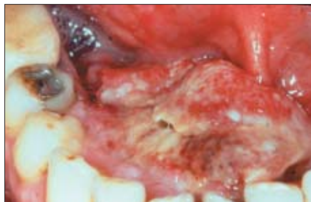
Figura 2. Carcinoma del suelo de la boca en un gran fumador.