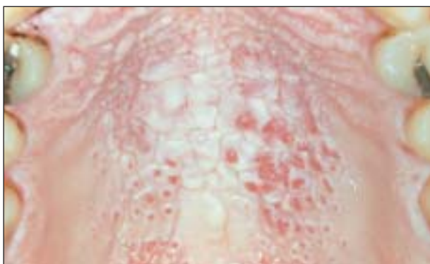
Figura 5. Paladar del fumador en un fumador en pipa.