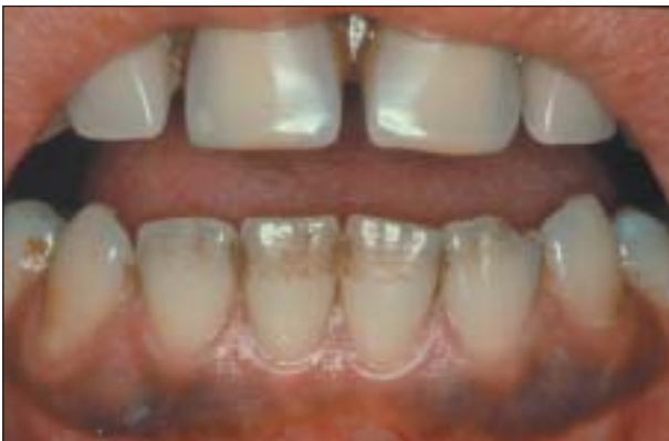
Figura 7: Melanosis del fumador.

En el lugar en que se coloca, el tabaco de mascar provoca recesiones gingivales, así como estrías en la mucosa oral. Estas lesiones suelen ser reversibles.