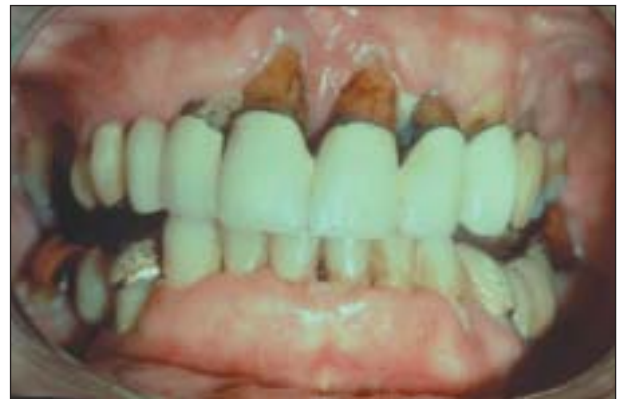
Figura 1. Periodontitis en el fumador.