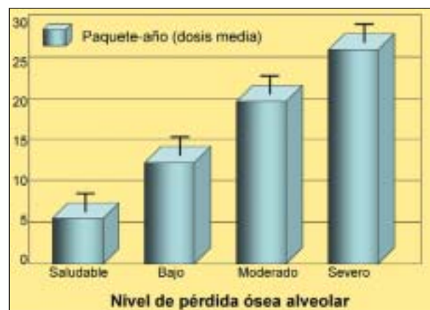
Gráfico 2. Relación entre la pérdida ósea alveolar y el número de cigarrillos.