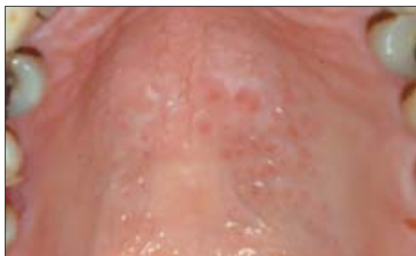
Figura 6. El mismo paciente 2 meses después de dejar de fumar.